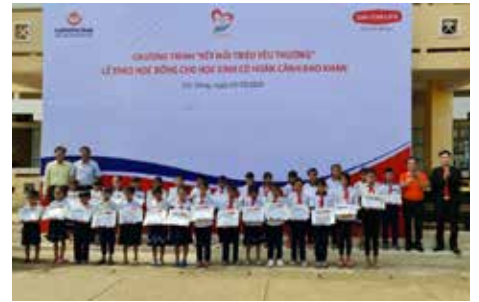
Dai-ichi Life Việt Nam và Ngân hàng Bưu điện Liên Việt trao 360 suất học bổng cho học sinh trường Tiểu học Mỹ Xuyên 1, huyện Mỹ Xuyên, tỉnh Sóc Trăng.

Nhân dịp Hội nghị Dịch vụ Khách hàng của Dai-ichi Life Việt Nam được tổ chức tại 03 tỉnh: Khánh Hòa, Hà Nội, Bà Rịa - Vũng Tàu, Quỹ Vì cuộc sống tươi đẹp đã trao 210 suất học bổng và quà trị giá 150 triệu đồng cho 150 học sinh vượt khó học giỏi tại 3 địa phương.