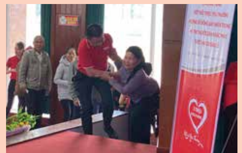
Sự ân cần làm ấm lòng người dân vùng lũ trong chương trình trao quà tại tỉnh Nghệ An của Dai-ichi Life Việt Nam, ngày 9/12/2020.