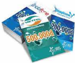
Nạp tiền điện thoại (Vinaphone, Mobifone, Viettel)