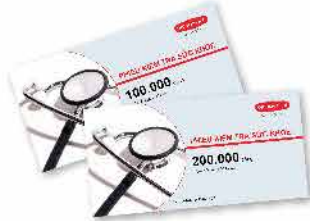
Phiếu khám sức khỏe