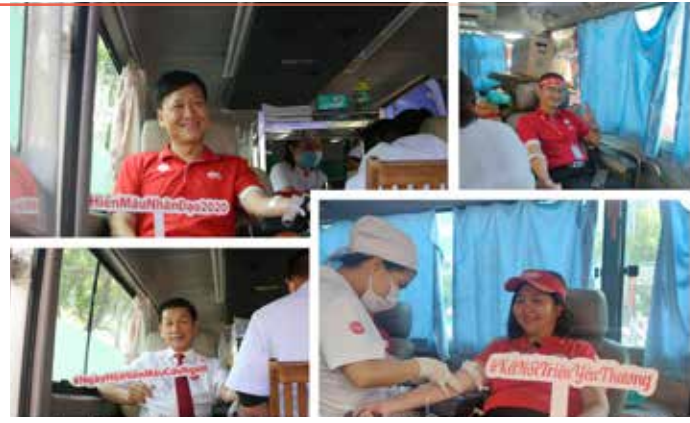
Ban Giám đốc Dai-ichi Life Việt Nam đồng hành cùng chương trình "Kết nối triệu yêu thương – Hiến máu nhân đạo 2020".

Hơn 500 tình nguyện viên, là Giám đốc các văn phòng Tổng Đại lý, đội ngũ quản lý kinh doanh, các Nhân viên và Tư vấn Tài chính của Công ty tại TP. Hồ Chí Minh và các tỉnh lân cận đã hiến tặng 403 đơn vị máu, tương đương 100.750 ml.