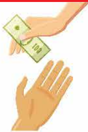
Đóng phí định kỳ