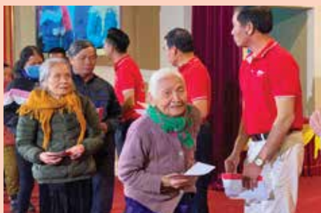
Những ánh mắt và nụ cười thân thương của bà con khi nhận quà trong chương trình "Hướng về đồng bào miền Trung" tại Hà Tĩnh vào ngày 9/12/2020.