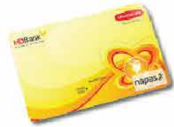
Thẻ trả trước đồng thương hiệu Dai-ichi & HDBank