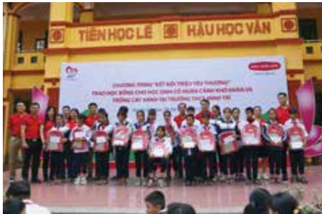
Trao học bổng cho học sinh trường THCS Minh Trí, xã Minh Trí, huyện Sóc Sơn nhân dịp Hội nghị Dịch vụ khách hàng khu vực phía Bắc của Dai-ichi Life Việt Nam được tổ chức tại TP. Hà Nội.

Nhân dịp Hội nghị Dịch vụ Khách hàng của Dai-ichi Life Việt Nam được tổ chức tại 03 tỉnh: Khánh Hòa, Hà Nội, Bà Rịa - Vũng Tàu, Quỹ Vì cuộc sống tươi đẹp đã trao 210 suất học bổng và quà trị giá 150 triệu đồng cho 150 học sinh vượt khó học giỏi tại 3 địa phương.