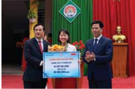
Dai-ichi Life Việt Nam và Sacombank trao bằng tượng trưng học bổng cho đại diện trường THCS Lý Thường Kiệt, quận Hải Châu, TP. Đà Nẵng.