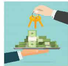
Đầu tư vào Quỹ mở DFVN