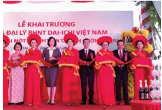
Văn phòng Tổng Đại lý thứ 5 tại tỉnh Quảng Ninh của Dai-ichi Life Việt Nam chính thức được khai trương tại TP. Hạ Long.

Với sự góp mặt của văn phòng Tổng đại lý thứ 5 tại Quảng Ninh, Dai-ichi Life Việt Nam đã có hơn 290 văn phòng “phủ sóng” trên toàn quốc, giúp Khách hàng thuận tiện hơn trong giao dịch đúng với phương châm hoạt động “Khách hàng là trên hết”.