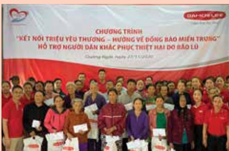
Những phần quà đầu tiên của chương trình "Hướng về đồng bào miền Trung" đến với người dân Quảng Ngãi vào ngày 27/11/2020.

Nhằm chung tay giúp người dân miền Trung khắc phục hậu quả những đợt thiên tai xảy ra liên tiếp trong thời gian qua, Quỹ Vì cuộc sống tươi đẹp của Dai-ichi Life Việt Nam đã khởi xướng chương trình "Kết nối triệu yêu thương – Hướng về đồng bào miền Trung" với số tiền gây Quỹ gần 5 tỷ đồng, do Dai-ichi Life Việt Nam cùng Nhân viên và đội ngũ Kinh doanh trên toàn quốc chung tay đóng góp. Chương trình đã được triển khai để hỗ trợ các hộ dân và khách hàng bị thiệt hại nặng tại 21 huyện, thị xã, thị trấn thuộc 7 tỉnh: Hà Tĩnh, Nghệ An, Quảng Bình, Quảng Trị, Thừa Thiên – Huế, Quảng Ngãi và Quảng Nam.