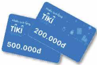
Phiếu quà tặng điện tử Tiki