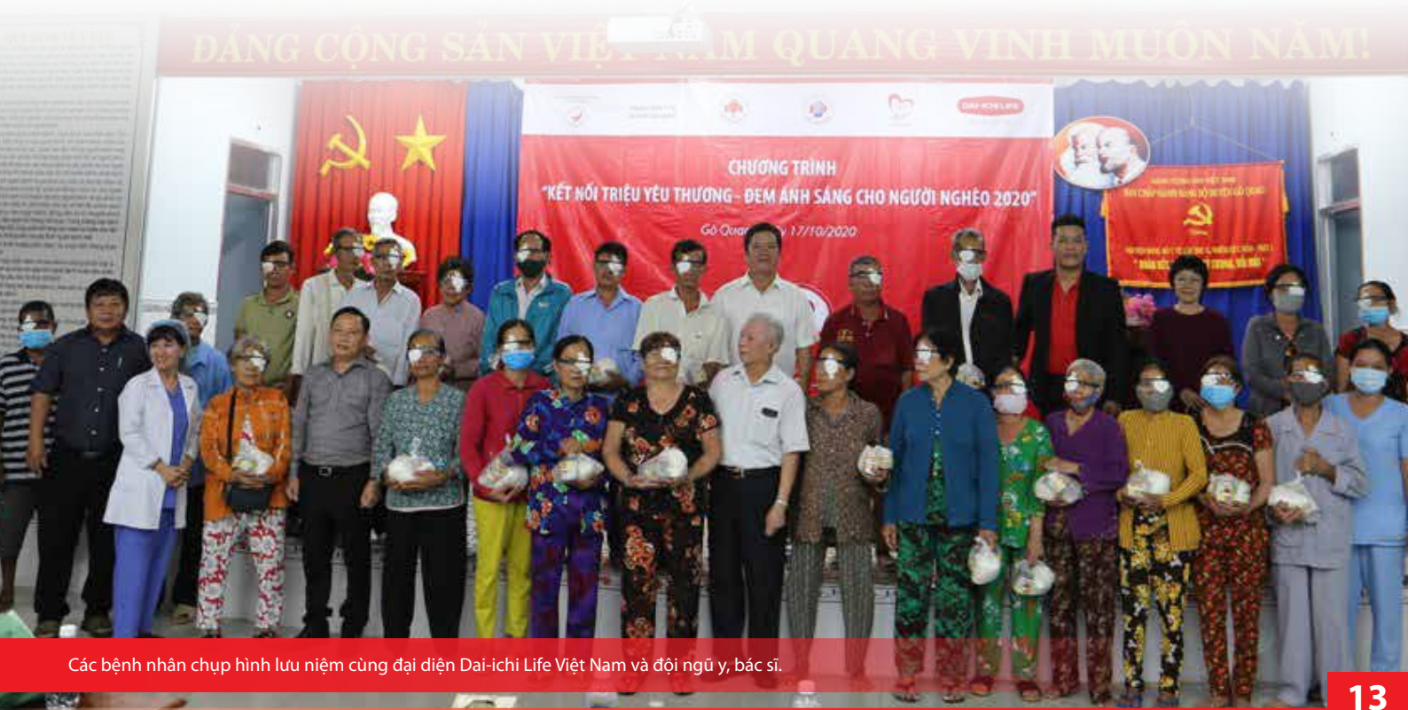
Các bệnh nhân chụp hình lưu niệm cùng đại diện Dai-ichi Life Việt Nam và đội ngũ y, bác sĩ.

Đây là đợt phẫu thuật thuộc chương trình " Kết nối yêu thương - Đem ánh sáng cho người nghèo 2020 " do Quý Vì cuộc sống tươi đẹp Dai-ichi Life Việt Nam tài trợ với tổng số tiền 400 triệu đồng, góp phần mang lại ánh sáng cho hơn 500 bệnh nhân nghèo.