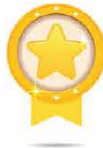
Tặng điểm cho Người thân