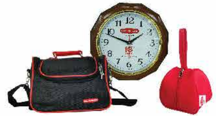
Quà tặng hiện vật hấp dẫn khác