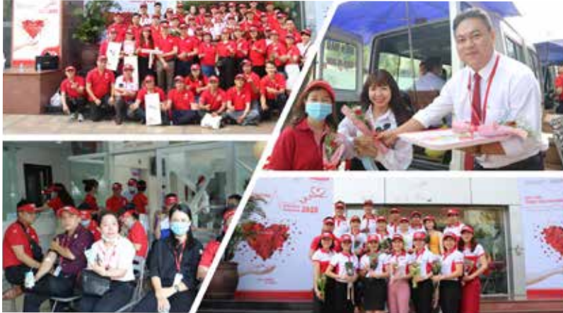
Sự tham gia nhiệt tình của đông đảo tình nguyện viên góp phần vào thành công của chương trình.

Đây là năm thứ 12 liên tiếp Dai-ichi Life Việt Nam triển khai chương trình nhân văn này hiến tặng tổng cộng hơn 5.783 đơn vị máu, tương đương 1.620.150 ml.