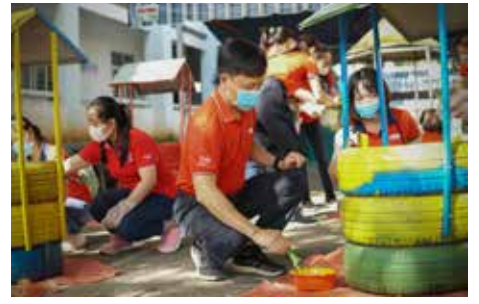
Ban Giám đốc và tập thể nhân viên Dai-ichi Life Việt Nam tham gia hoạt động trang trí các thùng đựng rác, trồng hoa và quét dọn khuôn viên trường THCS Nguyễn Du, TP. Bà Rịa, tỉnh Bà Rịa - Vũng Tàu.