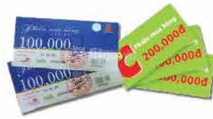
Phiếu mua hàng siêu thị Coopmart & Big C